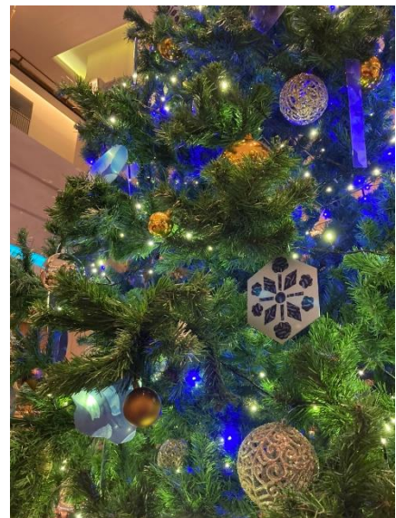
1階ロビー中央のクリスマスツリー