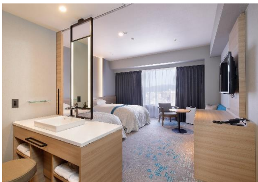
洗面台エリアをオープンにしたスーペリアツイン

エコノミーツインでは、ソファを設置するほか、スーツケースの収納スペースをベッド下に設け、コンパクトな空間の中、くつろぎのお時間をご提供いたします。