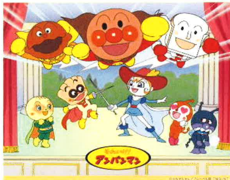
「それいけ！アンパンマン ショー～なきむしヒーローとゆうきのきし～」の告知ビジュアル

なお、本企画は、当ホテルが推進する「生涯顧客（ファン）」づくりの一環として、親子3世代で参加できる催しとしてご案内するものです。