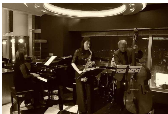
ダイニング&amp;バー「アプローチ」JAZZ生演奏