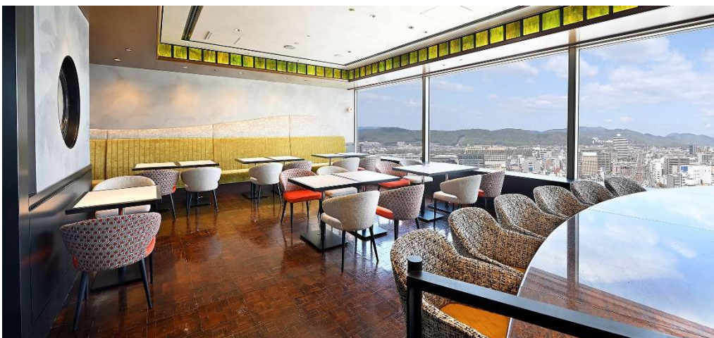
メンバー「リーダーズ」 ティータイム専用ラウンジ