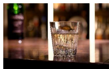
バータイム メニューの数々