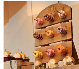
ティータイム メニューの数々