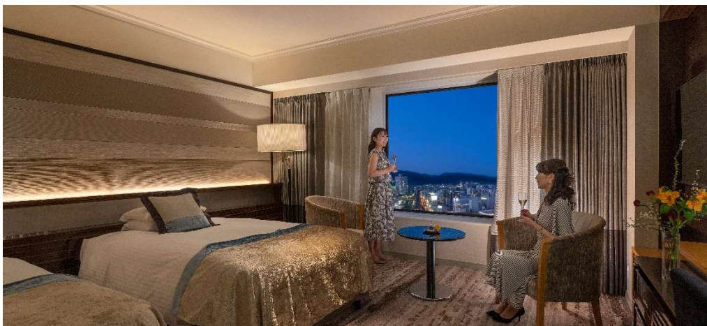
グランヴィアフロア 客室イメージ

https://www.granvia-oka.co.jp/stay/plan-stay/24403/