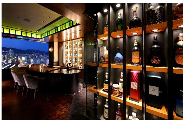
メインバー「リーダーズ」